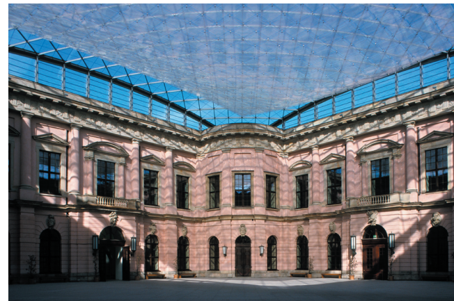
Zeughaus Berlin, Schlüterhof

Präsentation und Vortrag „Das deutsche Beispiel: Geschichte als Ressource unserer kulturellen und politischen Orientierung“